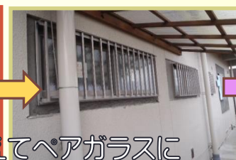
サッシを入れ替えてペアガラスに