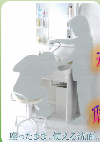
座ったまま、使える洗面。

今は必要ないけれど将来の事も考えて座ってでも 使える洗面台があればいいな・・・。 そんなことをお考えの方も少なくないはず。 そんな方にピッタリの商品をご紹介します。