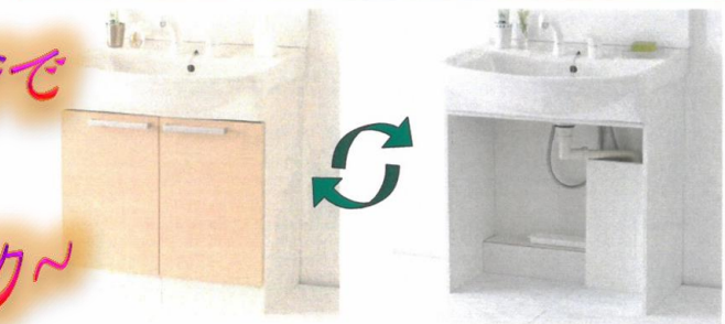
扉が付いている状態

扉付きからオープンに、オープンから扉付きに工具なしで変更できます。 ※扉付き収納・オープン両用タイプのみ