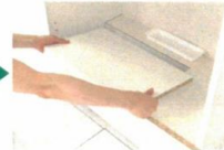
底板部分も工具なしで取り外しが可能。