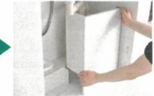
取り外した底板の一部は配管カバーとなります。