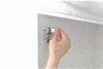
蝶番も工具なしで取り外し可能。